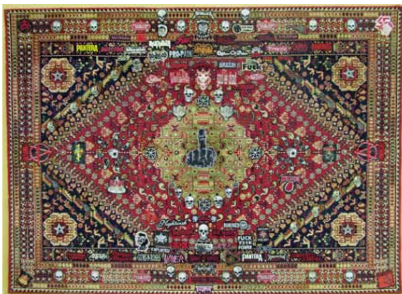
tapis violent , 4 sur 10, Théo Mercier, tapis de laine, écussons, clous. 200X300cm collection de l'artiste

Les traces de ses expérimentations sont conservées le plus souvent dans des photographies, des dessins et des collages qui mettent en scène des objets trouvés, tels des acteurs jouant un rôle confus dans des décors incongrus. Le geste de l'artiste se retrouve aussi bien dans ses œuvres graphiques sur papier que dans les assemblages curieux qu'il réalise pour ses prises de vue. Les couleurs choisies avec une sensibilité paradoxale puisent leur source dans l'iconographie populaire et soulignent l'artificialité des contextes.» Sári Stenczer