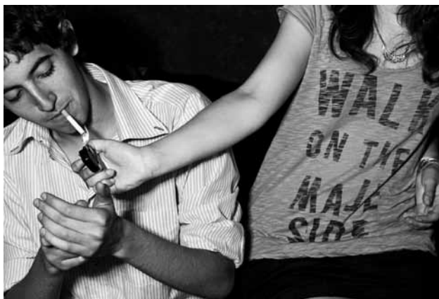
Lausanne, Switzerland - June 2009. Germinal Roaux Diary

Avant tout perçu comme un moment de crise par l'adulte, l'adolescence est davantage la période d'indétermination dans la quête d'une identité propre. C'est à cela que s'attaque Germinal Roaux à travers une vingtaine d'images en noir et blanc issues d'une série plus importante intitulée Never Young Again réalisées en Suisse mais aussi au Mexique et en France. C'est une adolescence avec tous ses paradoxes qui nous y est présentée. Les gestes et les regards aussi maladroits que déterminés, les subversions comme les transgressions donnent à voir ce qui stigmatise toutes sortes de maux aux yeux de l'adulte. Evocations d'une jeunesse dont il garde une certaine nostalgie, les hésitations comme la liberté que l'adolescence revendique s'expriment notamment dans les images de Germinal Roaux dans la pratique communautaire du rock comme celles du skate ou du tatouage. Souvent photographiés dans des attitudes que l'on pourrait qualifier de fières, il n'est pas rare non plus de deviner des émotions plus troubles chez les modèles comme celles liées aux premiers émois amoureux.