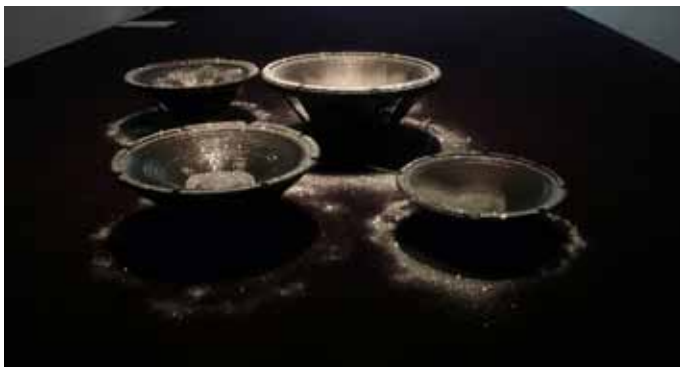
Wilderness , Olivier Dollinger 2007 hauts parleurs, paillettes dimensions variables

Artiste français multidisciplinaire, Olivier Dollinger présente une œuvre constituée de quelques haut-parleurs qui diffusent une chanson de Joy Division Wilderness en se contentant de reproduire le mouvement des basses fréquences. Cette pièce propose un autre temps, ou plus exactement, un autre tempo : les paillettes argentées qui remplissent les haut-parleurs virevoltent au gré des vibrations, créant tantôt de petites éruptions volcaniques, tantôt des formes géométriques ou nébuleuses. Un monde défaillant est dès lors offert aux yeux du spectateur qui se retrouve aussi démuné face à ses incertitudes que la rythmique orpheline.