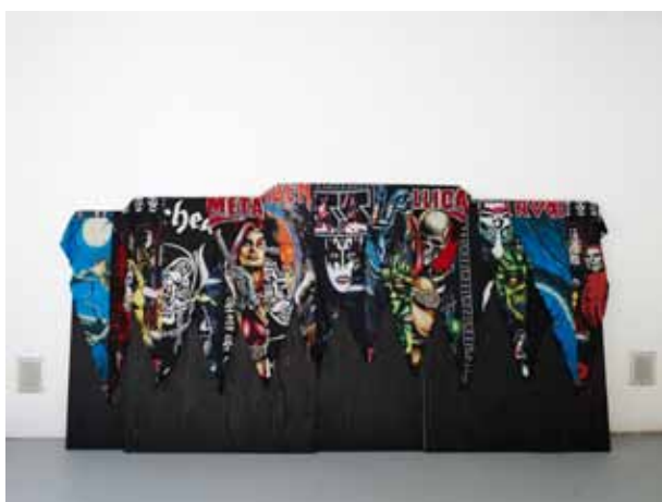
Ironhead , Elise Gagnebin-De Bons 2009 tissu et bois 180x263 cm

Dès ses premières expositions, Elise Gagnebin-de Bons s'est attachée à montrer des œuvres où une violence retenue crée la tension et balance le spectateur entre une réalité dure et un imaginaire fantasmé. Elise Gagnebin-de Bons démontre dans son travail une fascination particulière pour les phénomènes de société violents, les comportements et symboles de groupes marginaux et cachés, porteurs de révolte. Sociétés secrètes, fans de Death Metal, hooligans, autant de regroupements d'individus évoluant en marge d'une normalité reconnue et qui attirent irrémédiablement l'artiste.