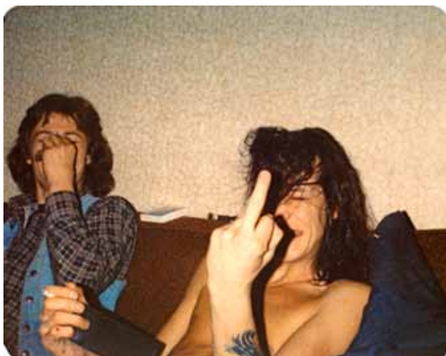
Swinging Lumpen , Steven Shearer 2000 Photolaminate, acrylic on canvas Image 109.2 x 137.2 cm / 43 x 54 inches Courtesy Galerie Eva Presenhuber, Zürich. © the artist

Usant d'un certain classicisme comme d'une incroyable contemporanéité, Steven Shearer produit un art de l'observation où la musique transparait souvent. Les sujets de Steven Shearer se concentrent ainsi principalement sur la jeunesse, l'aliénation et la violence latente. Son univers est habité par des rockers, des fans de death-metal, des « boys bands » préfabriqués des années 1970 et des idoles de teenager, des glam-rockers et des adolescents s'exerçant à la guitare dans leur garage de banlieue. C'est avec la plus grande attention qu'il dresse le portrait de jeunes hommes cachés sous des chevelures interminables. Ses pastels doux et ses collages d'images sélectionnées sur internet transforment l'image au potentiel dur du monde métal en un univers délicat, tranquille, plein de mélancolie.