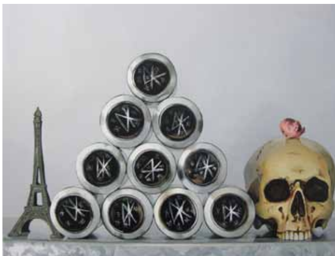
I Kill Children , 2009, © Elodie Lesourd (Courtesy C. Lévêque), acrylique sur MDF 36x43.8 cm

L'Hyperrockalisme est le principe de transposition en peinture d'installations d'artistes. A la fois hommage et critique, ce travail s'inscrit dans une perspective post-moderne du rapport à l'artiste, à l'œuvre, à l'image. Mais l'hyperrockalisme, c'est aussi passer au-dessus du rock pour mieux en explorer les profondeurs. Dépasser les codes, ceux du rock et de la peinture (hyperréaliste), par la peinture « rock » elle-même. Le refus des procédés mécaniques de reproduction (rétroprojection, mise au carreau) est un retour aux racines du rock, voire du punk. Une sorte de « Do it Yourself » mêlé à la tradition picturale séculaire du « savoir-faire ».